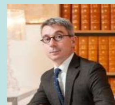
par Maître G. Nallet, Notaire