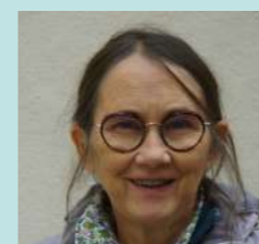
par Marielle Lachenal, Parent, Formatrice CAA