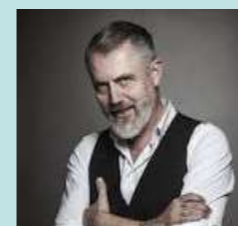
par Alain Guyard, Philosophe